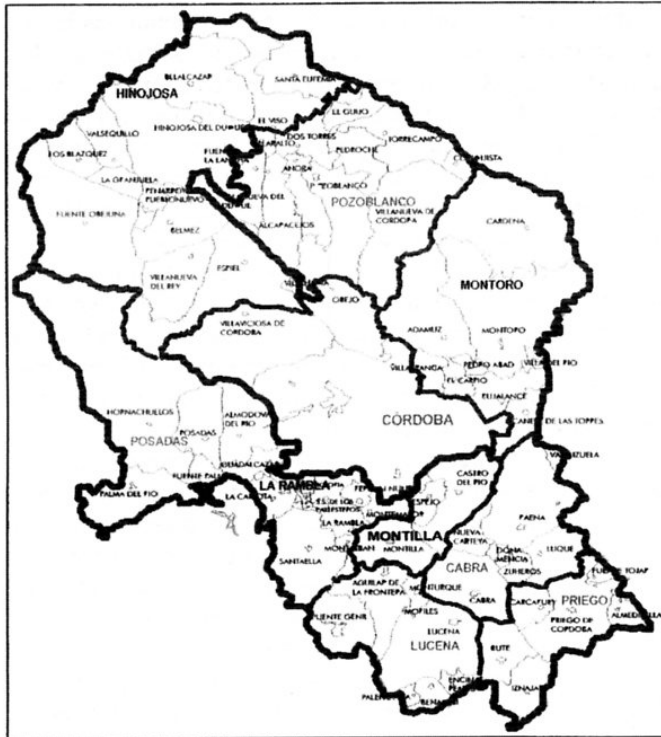
MAPA 2: PARTIDOS JUDICIALES DE LA PROVINCIA DE CÓRDOBA DURANTE 1924-1931

XX 20 , según unas leyes electorales tendentes a buscar una base eficaz de organización, al tiempo que pueden servir para favorecer la supresión de una tendencia política determinada, en detrimento de las demás 21 .