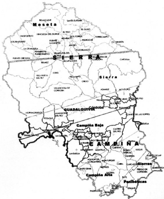
MAPA 1: REGIONES AGRARIAS DE LA PROVINCIA DE CÓRDOBA

Belmez, Espiel y Peñarroya, dando origen a una minería del carbón que, junto al desarrollo del ferrocarril y a las inversiones extranjeras, generó unas peculiares características sociales y económicas de fuerte contraste con el resto de la provincia, frente a unas dehesas que necesitan escasa mano de obra, legiones de obreros se concentraban en una zona que devino en conflictiva cuando cesó el auge minero 10 .