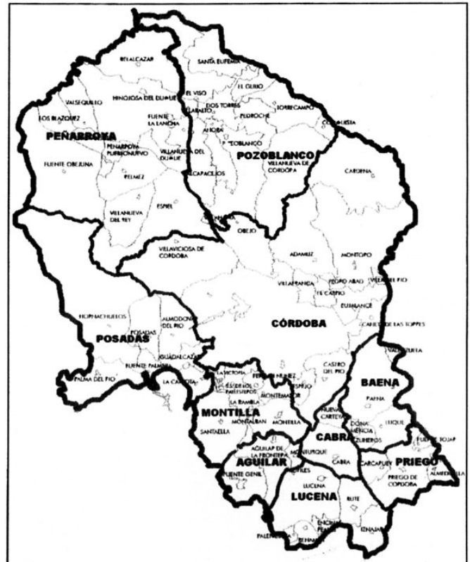
MAPA 4: PARTIDOS JUDICIALES DE LA PROVINCIA DE CÓRDOBA 1979-1995

El secular problema del paro masivo en el medio rural andaluz, que llegaba a las puertas del nuevo régimen democrático con la esperanza de ser resuelto, era un problema grave, omnipresente conflictivo, de ahí la enorme importancia social que adquieren en los pueblos andaluces los sistemas de subsidio. Durante el franquismo, igual que se había hecho en el régimen primorriverista, se recurrió a las obras públicas para amortiguar el proble-